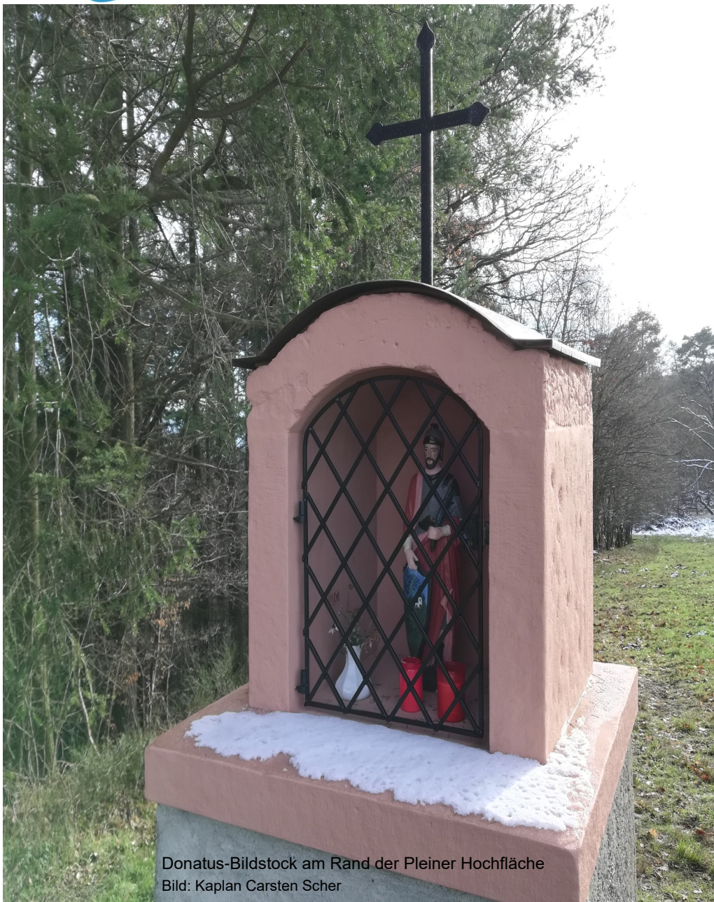
Donatus-Bildstock am Rand der Pleiner Hochfläche