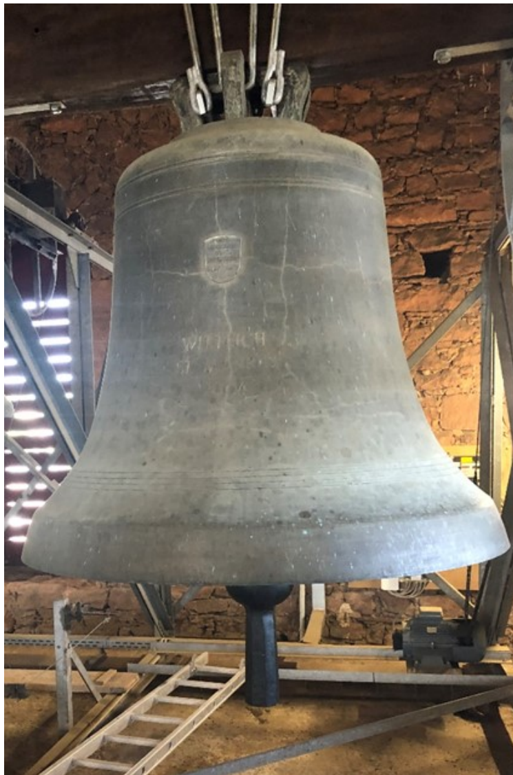
Blick auf die zweitgrößte Glocke im Geläut der St. Markuskirche, St. Markusglocke, Ton d', ca. 1400 kg, gegossen im Jahre 1708