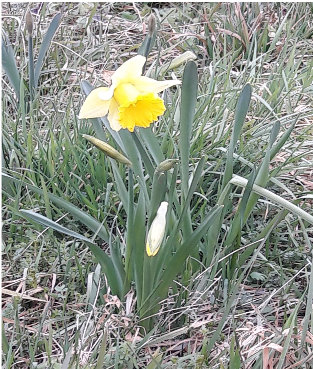
Osterglocke am Mesenberg in Wittlich